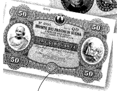
LA CONTAZIONE Cinquanta lire del Monte dei Paschi della seconda metà dell'800. Sopra la "contazione" (il conteggio) delle monete, in una illustrazione del 1902