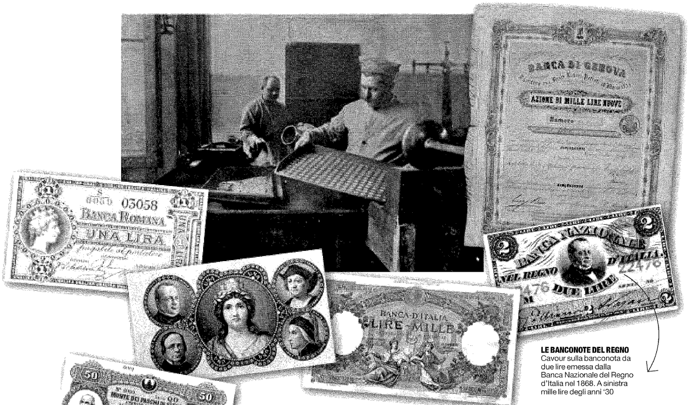
LE BANCONOTE DEL REGNO Cavour sulla banconota da due lire emessa dalla Banca Nazionale del Regno d'Italia nel 1868. A sinistra mille lire degli anni '30